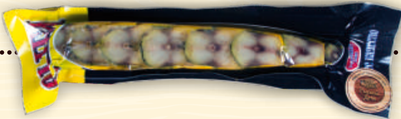
Набор к пиву из скумбрии холодного копчения