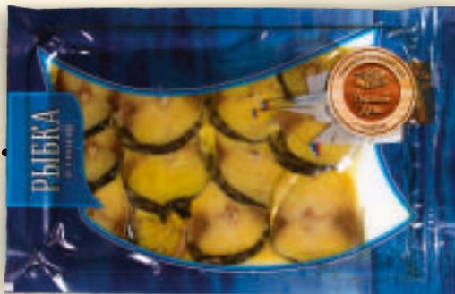
Ассорти скумбрия и горбуша кусочки холодного копчения