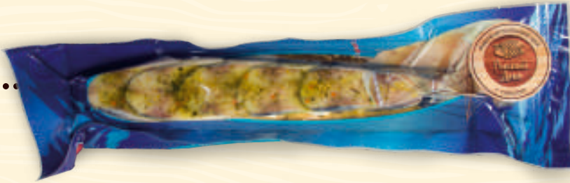
Косичка из скумбрии пряного посола весовая