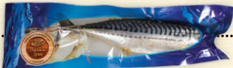
Скумбрия пряного посола весовая