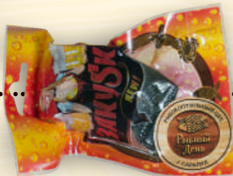
Форель кусок холодного копчения весовая