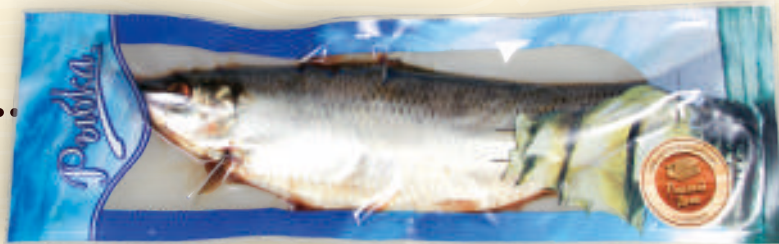
Сельдь с/соленая весовая