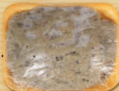
Фарш из минтая