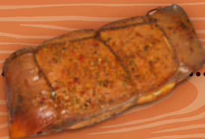
Рулет из скумбрии со специями