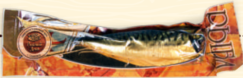
Скумбрия горячего копчения весовая