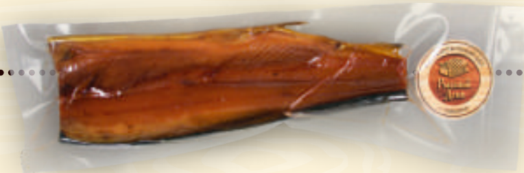
Набор к пиву из горбуши холодного копчения