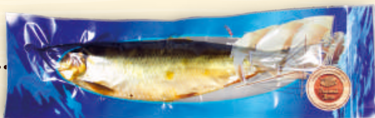
Сельдь горячего копчения весовая