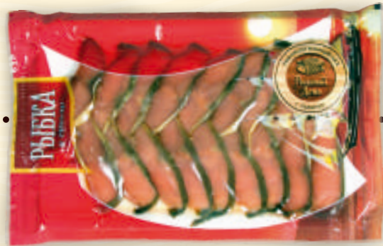
Горбуша кусок холодного копчения весовая