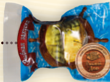
Скумбрия кусочки холодного копчения