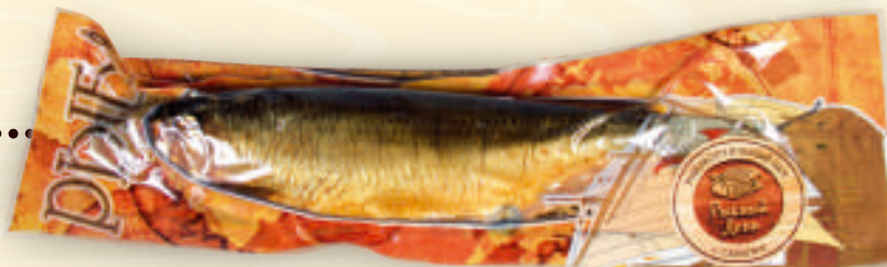
Сельдь холодного копчения весовая