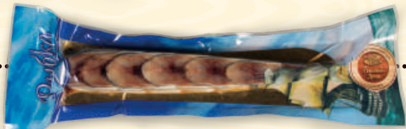
Косичка из сельди с/соленой весовая